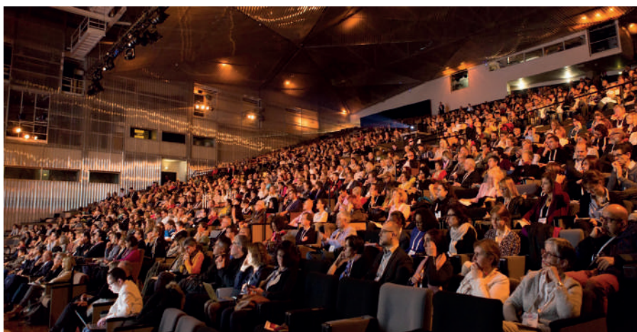
© SFETD - Congrès national 2018

Plus d'informations sur le communiqué de presse.