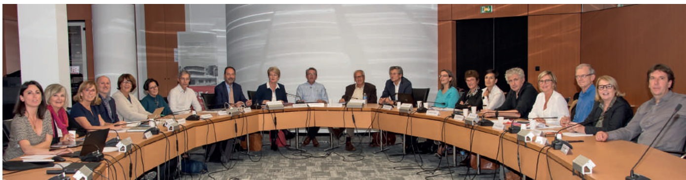
© Fondation APICIL - Réunion des Conseils d'Administration et Scientifique

La Fondation APICIL est sollicitée par des soignants, des associations de patients, des organismes de recherche qui ont des idées innovantes et audacieuses pour améliorer la prise en charge de la douleur. Elle encourage les pratiques complémentaires, l'évaluation des techniques, la recherche, la formation du personnel médical et l'information de tous les publics. Pour être retenu, un projet doit répondre à un certain nombre de critères dont la reproductibilité, l'essaimage, la faisabilité à plus grande échelle, la notion d'intérêt général et l'engagement de la structure.