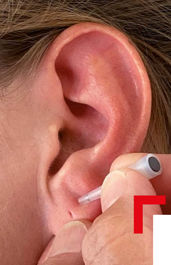
Mise en place d'une aiguille semi-permanente.