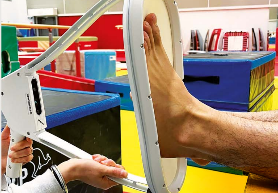
Prise d'empreintes 3D pour réalisation semelles orthopédiques.

Parmi les 115 patients pris en charge, 61 ont suivi le parcours complet avec des améliorations de la douleur, d'endurance, d'humeur et de qualité de vie.