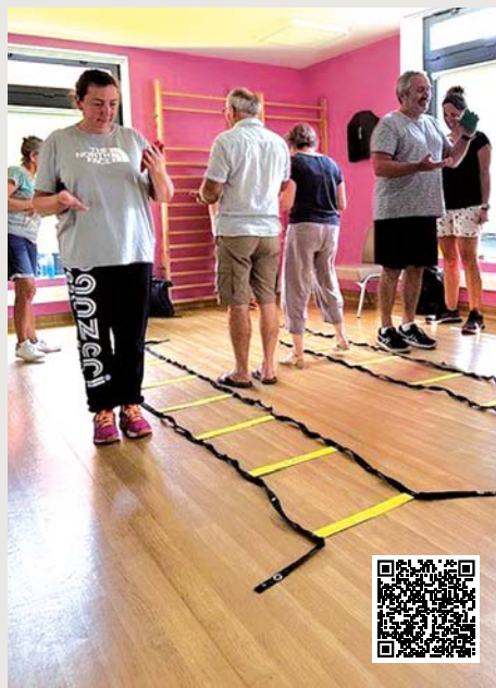
Atelier Brain Ball au Centre Hospitalier de la Côte Basque, Bayonne.

5 ans après la crise de la Covid-19, certains patients souffrent toujours de COVID long, une affection encore mal connue, marquée par des douleurs persistantes, une fatigue chronique et un retentissement majeur sur la qualité de vie.