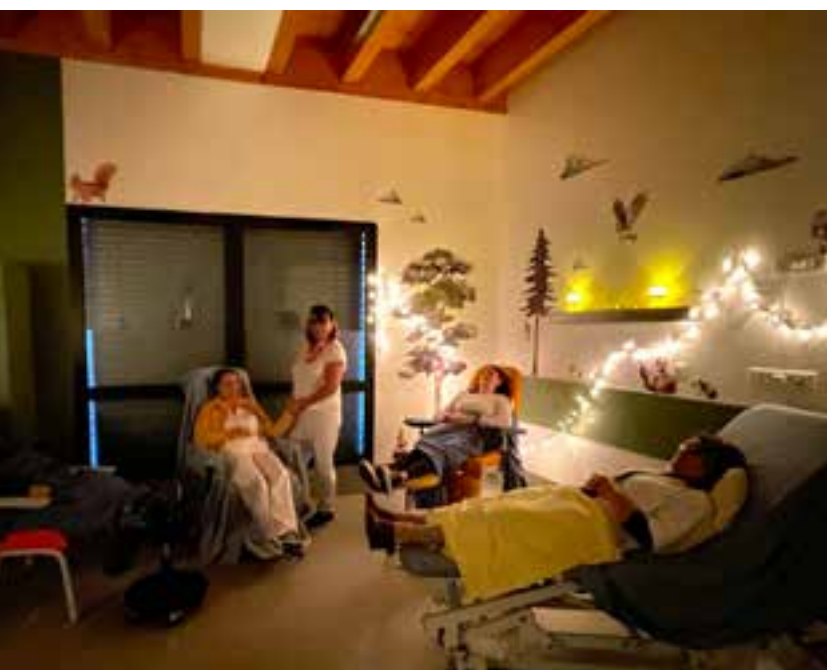
Journée dédiée à la découverte des moyens de lutte contre la douleur

Formation des soignants de l'ESEAN à l'hypnoanalgésie pour améliorer la prise en charge de la douleur et notamment la douleur chronique chez l'enfant et l'adolescent.