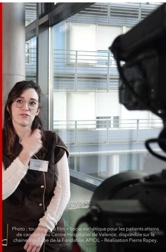
Photo : tournage du film « Socio-esthétique pour les patients atteints de cancers » au Centre Hospitalier de Valence, disponible sur la chaîne YouTube de la Fondation APICIL - Réalisation Pierre Rapey.

des articles paraissent dans la presse nationale et contribuent à faire de la lutte contre la douleur un sujet de société